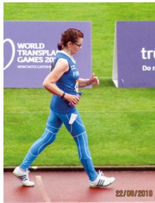
3 000 m kävely Newcastle'n MM kisoissa. Kuva Esko Sohlo, 2019.

Teho-osastolla muistan olleeni horroksessa. Näin kaikenlaisia unia, vuoroin olin Virossa ja vuoroin virolaiset olivat täällä. Aina kun laitoin silmät kiinni, oli ihan kuin olisin ollut veden alla ja katossa oli kaikenlaisia