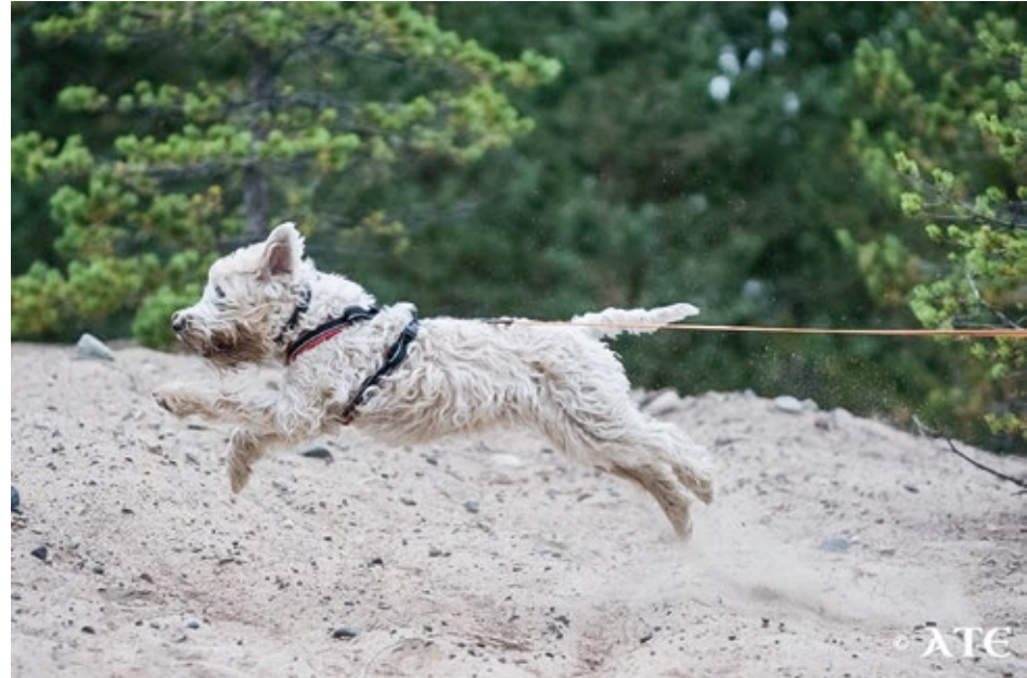
Lentävä Nita. Vauhdilla takaisin maalin luokse!

Entäpä pikku-Nita? Perheeseemme tuli kolme vuotta sitten toinen vehnäterrieri, joka sai nimekseen Nita. Nitän koulutus pelastuskoiraksi alkoi jo noin kymmenen viikon ikäisenä. Jälkien haistelemisen on koirien geeneissä, joten siitä on helppo aloittaa. Koiralle vain opetetaan, että palkkaa tulee nimenomaan ihmisen