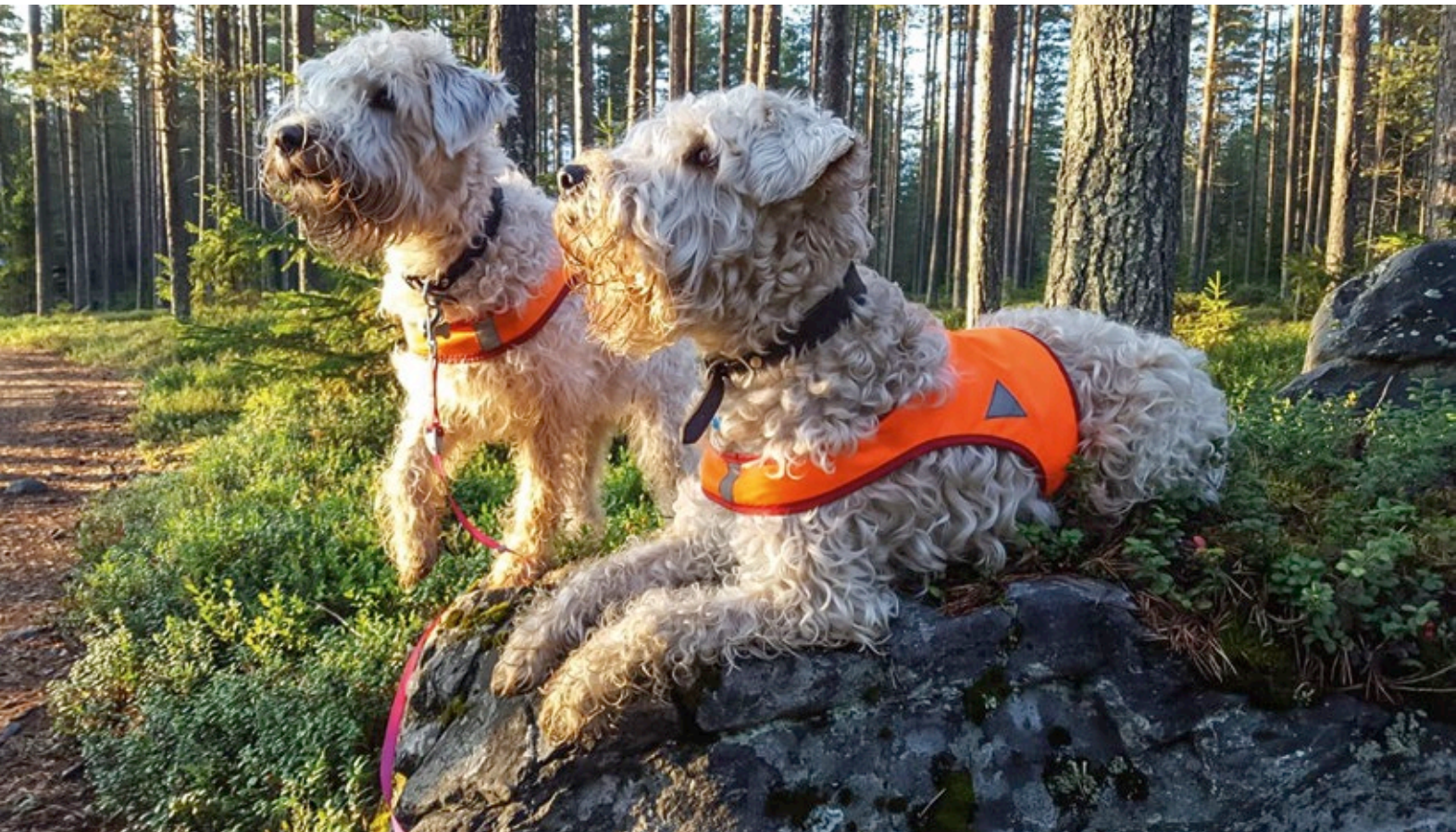
Kyllä minä pysyn paikallani, anna jo se nami!

Tämän harrastuksen myötä olen päässyt mukaan vapaaehtoistoimintaan, joka yhdistää luonnossa liikkumisen ja koiran kanssa harrastamisen. Olen tutustunut moniin ihmisiin, joista monesta on tullut uusi, aikuisiän hyvä ystävä. Molemmat koirani saavat käyttää lajilleen luonteenomaisesti nenäänsä etsimiseen ja siinä samalla niiden lihaskunto pysyy hyvänä epätasaisessa metsämaastossa juostessa. Toivon, että meillä on vielä paljon yhteisiä vuosia edessä tämän elämää suuremman harrastuksen parissa. ■