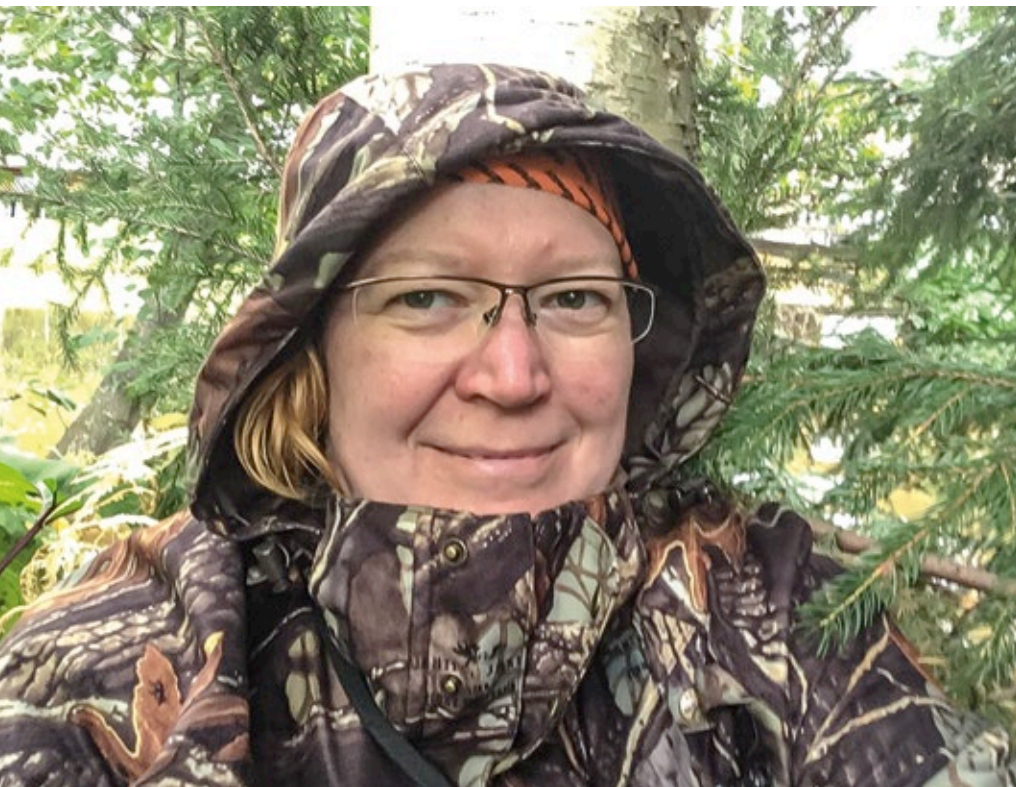
Maalina hakumetsässä.

Tällaisessa harrastuksessa saa olla luonnon helmassa, mutta myös luonnon armoilla. Treenaus tapahtuu pääasiassa ulkona ja kaikissa olosuhteissa, jotta myös koirat tottuvat työskentelemään säällä kuin säällä. Kevät on mielestäni parasta aikaa. Heti kun lumet alkavat sulaa, pääsemme tekemään jälkiä ja taas pitkästä aikaa kävelemään pehmeässä sammalikossa tai rapisevalla jäkälällä. Lentävät öttiäiset eivät ole vielä heränneet ja linnut pitävät upeita konsertteja. Mikä voisi olla ihanampaa kuin kuunnella niiden