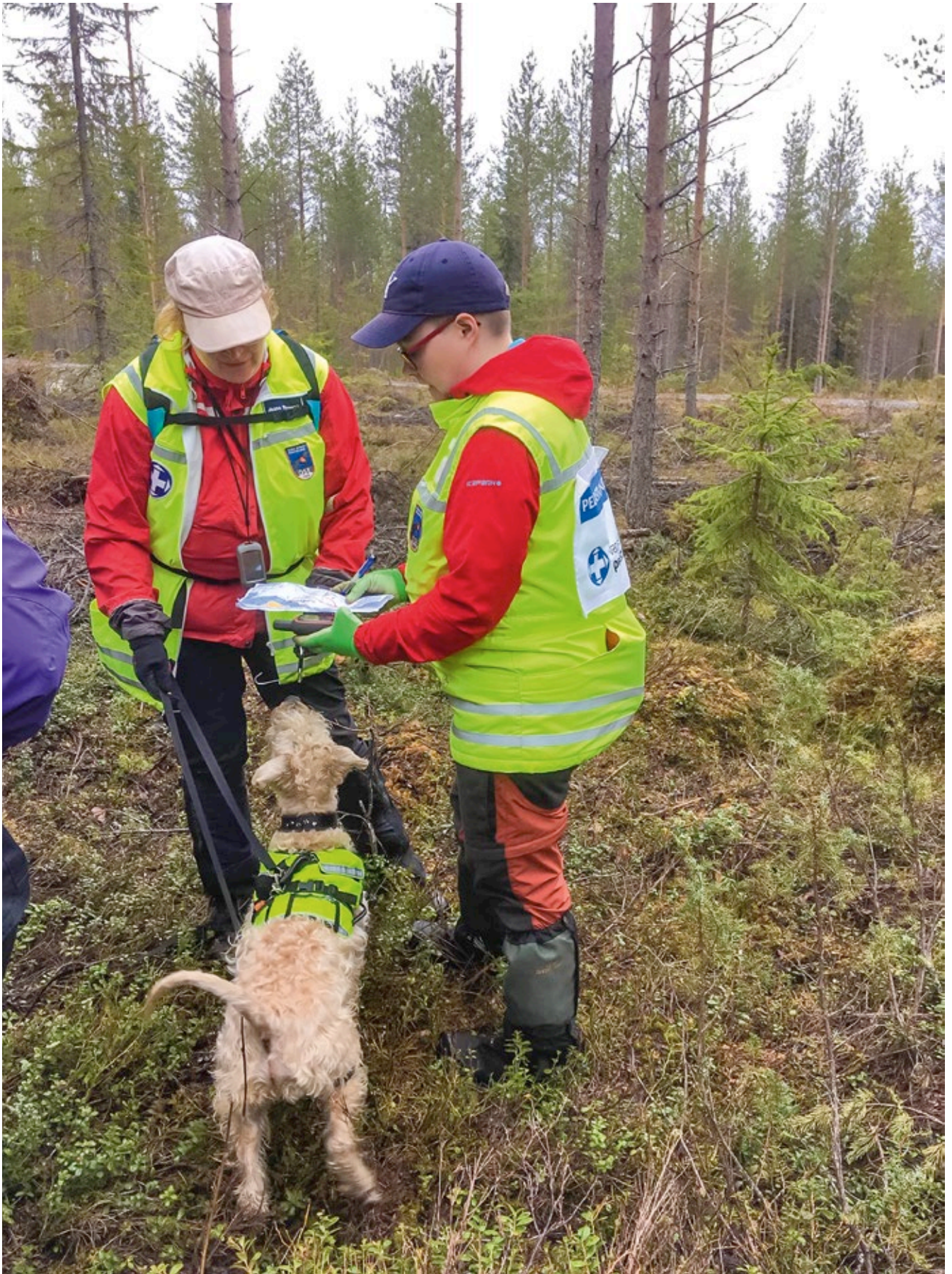
Etsintäsuunnitelman tarkistaminen. Kartanlukutaito on välttämätön pelastuskoiraharrastuksessa. Kuva Eeva Kaataja, 2019.